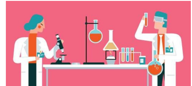
Laboratoire de recherche