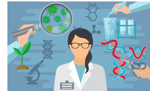
Laboratoire de biotechnologie