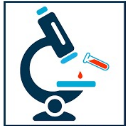
Laboratoire de biologie médicale