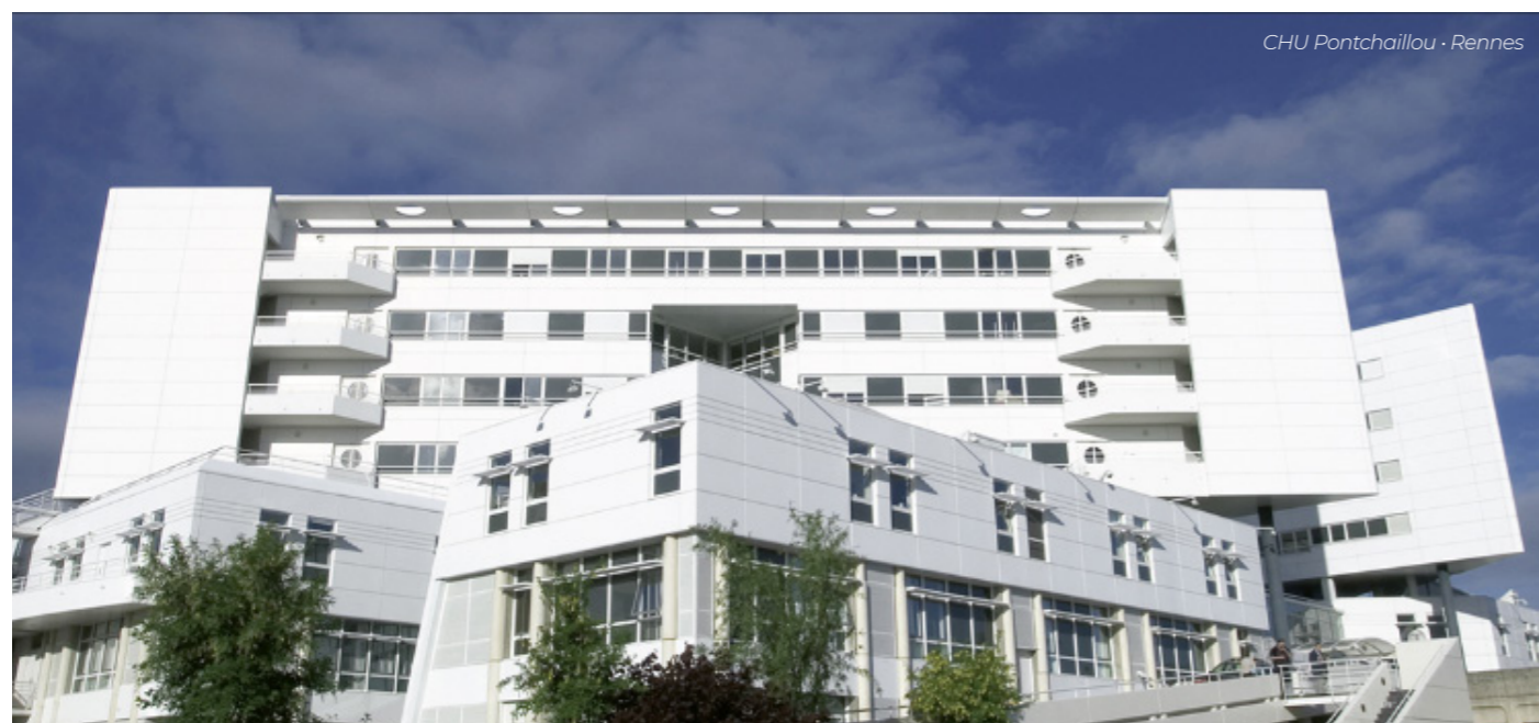
CHU Pontchaillou - Rennes

Nous terminerons cette journée professionnelle par les actualités de l'association et du conseil national professionnel des TLM qui, n'en doutons pas, seront nombreuses et prometteuses pour les techniciens de laboratoire médical.